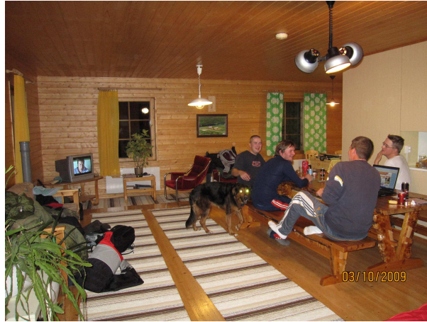
Jokela –talossa riitti tilaa kaikille

Illan hämärtyessä porukkaa valui kämpille, suurempia saaliita ei kuulemma ollut tullut. Päivä oli kuitenkin erittäin onnistunut ja sää suosi auringonpaisteella. Alkuillasta sitten saunottiin ja kerrottiin kalajuttuja. Illan mittaan jutut suuntautuivat jo kohti Vaajavirran kuningaskalastaja – kilpailun viimeistä osakilpailua, avauspäivän Suurin taimen –kisaa ja tiukkaa spekulointia käytiin kuka siellä tulee pärjäämään ja kuka ei. Saapas nähdä kenen kehu kestää kun pilli viheltää klo 00.00 16.marraskuuta.