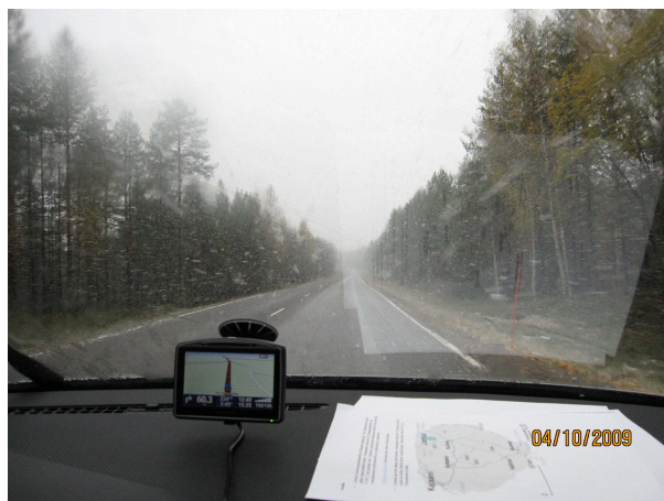
Räntää ja lumisadetta kotiintulomatalla