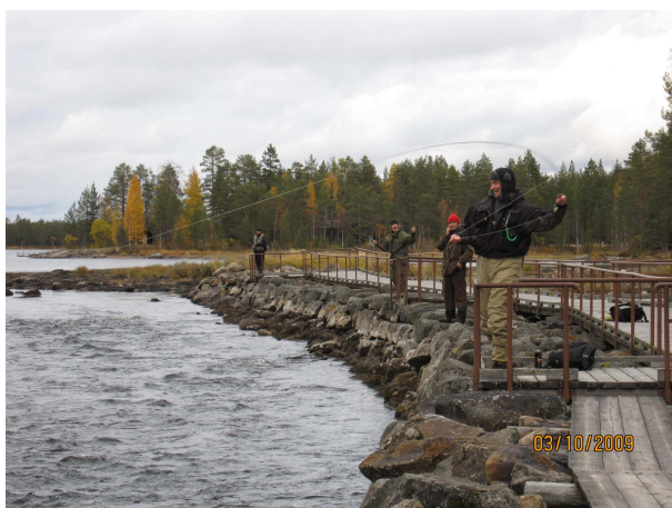
Peten taimen sai kalamiesten siimoihin liikettä