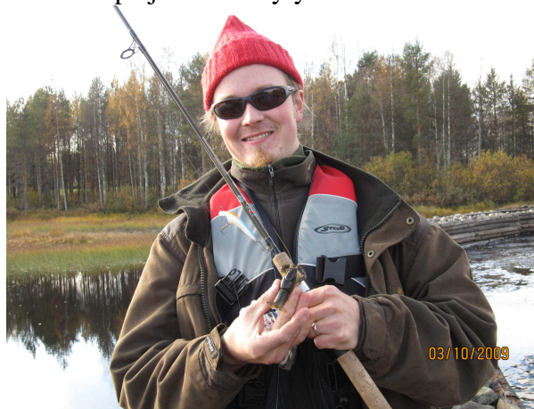
Reissun ensimmäinen saalis

Aamulla kävimme lunastamassa kaikille kalaluvat, jotka olivatkin erikoiset ”reilun vuorokauden” luvat. Vuorokausilupa nimittäin kesti luvan kirjoittamishetkestä seuraavan vuorokauden loppuun asti. Luvan hintakaan ei ollut kuin huimat yhdeksän euroa. Kaikki eivät olleet vielä ehtineet edes kalaan, kun huhut ensimmäisestä saaliista kiirivät leirintäalueelle. Ja niinhän siellä pojat jo olivat saaneet vedenelävän saaliiksi – nimittäin ravun. Tarkemmin katseltuamme rapuja näkyi siellä täällä keskellä kirkasta päivää, joten melko paljon niitä täytyi olla.