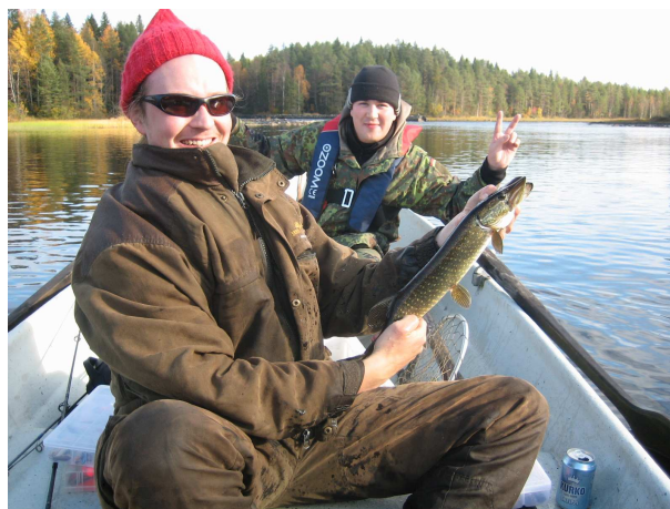
Ojakonna ja pyytäjät esittäytyvät