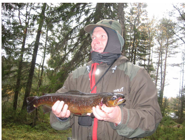
Taimen näteimmästä päästä ja edustava on pyytäjäkin 😊