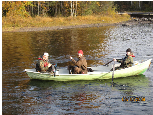
Ojakonnan pyytäjät yläkosken alaosalla