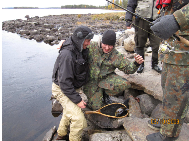
Se on naukun paikka pojat!

Kalaakin alkoi nousemaan, taisi suurin olla n. 30 cm taimen alosalta koskea. Lisäksi niskalta saatiin muutamia harjuksia, tosin pieniä nuo olivat. Petellä oli vielä parempi kala hetken aikaa kiinni vaapussa, mutta pääsi irti. Hetki näiden tapahtumien jälkeen tartutin niskalta pieneen kyylanymfiin mukavan kokoisen taimenen. Enpä olisi heti veikannut yli puolimetriseksi tätä laiskaa kalaa, mutta oli se uskottava, kun pinnassa selän näin. Ei ollut kaverilla menohaluja koskeen, vaan tuli suosiolla haavin pohjalle ja päivän toinen ruokakala oli tosiasia. Eipä mennyt kauaa, kun oli kahdeksan henkeä kokoontunut juhlistamaan taimenta. Asiaankuuluvat kuvat ja naukut otettiin hienolle taimenelle. Pikkuhiljaa porukka hajaantui, itse lähdin kävelemään kohti alakoskea ja saunan lämmitykseen.