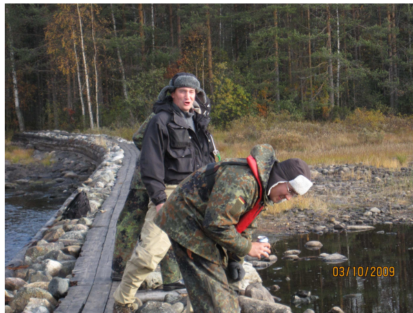
Juu-u, kyllä siellä rapuja on!

Alakoski tuntui olevan tyhjä kaloista, yhtään varmaa tärppiä emme parin ensimmäisen tunnin aikana sieltä saaneet. Paikallinen vanhempi herrasmies heitteli pieniä perhoja heittokohon kanssa ja nappasikin pari 20-30 cm pitkiä taimenen penikoita. Kuinka ollakaan hän näytti puukkoa molemmille kaloille! Ilmeisesti tammukanpyynti –kulttuuri on vielä voimissaan Kuhmossa päin. Tässä vaiheessa minullekin riitti ja suuntasin kohti yläkoskea, missä muut olivat.